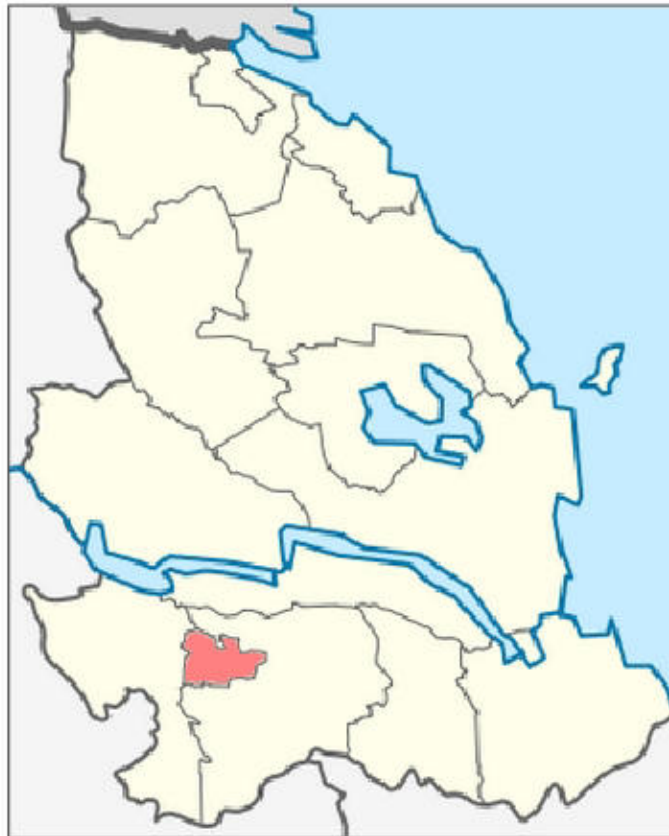
Рисунок 1.1 – Территориальное расположение «МО Мичуринское сельское поселение»