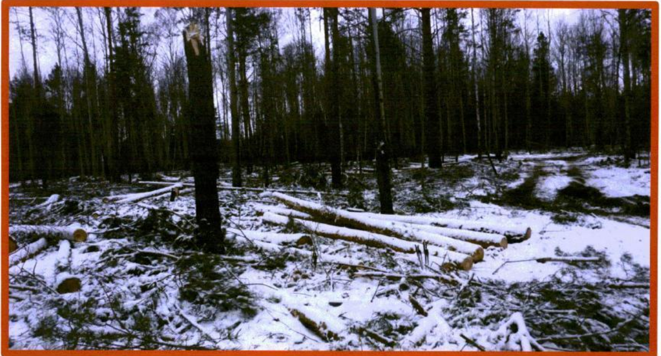
Изображение № 7 Брошенная древесина вдоль лесовозных дорог. Не является валежником