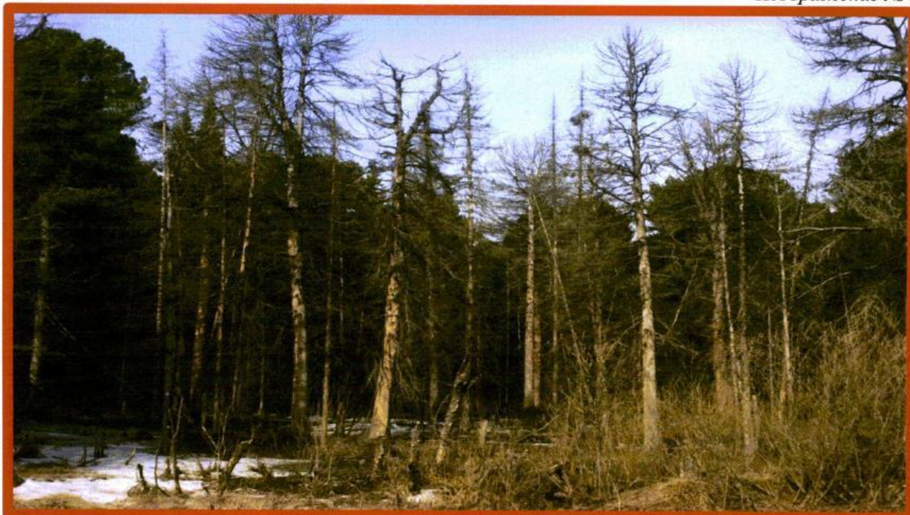
Изображение № 4 Сухостойное дерево. Не является валежником Изображение № 5

Кроме того, необходимо обратить внимание, что деревья, которые лежат на земле, но не имеют признаков естественного отмирания (имеют зеленую листву или хвою), определять как «мертвые» не допускается (смотри изображение № 5).