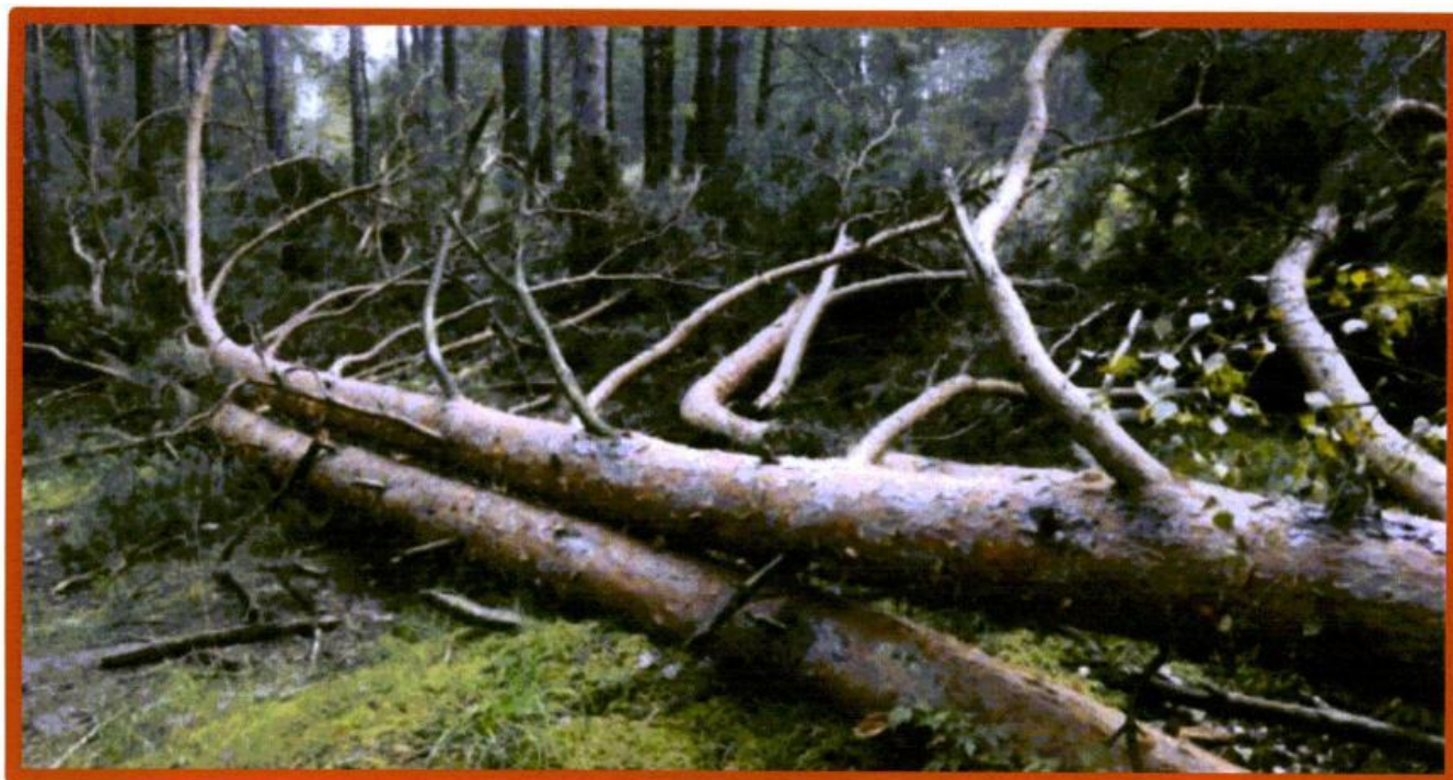
Лежащее на поверхности земли ветровалное дерево, не имеющее признаков отмирания. Не является валежником

Кроме того, необходимо обратить внимание, что деревья, которые лежат на земле, но не имеют признаков естественного отмирания (имеют зеленую листву или хвою), определять как «мертвые» не допускается (смотри изображение № 5).