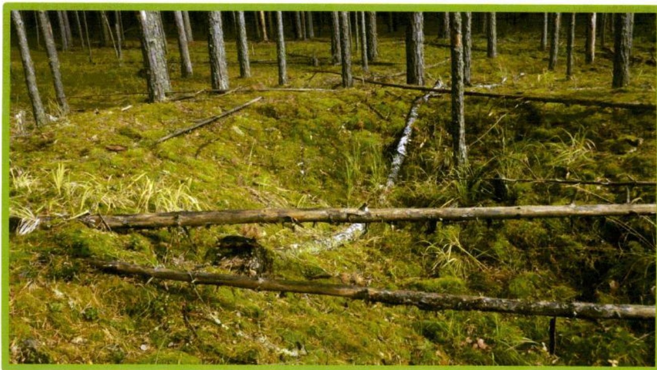
Изображение № 1 Валежник

Примеры валежника (смотри изображения №№ 1,2,3).